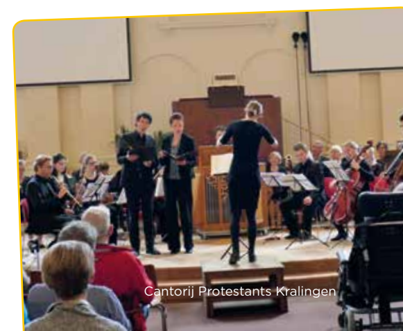
Cantorij Protestants Kralingen